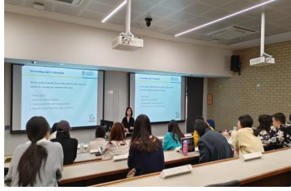
参加西澳大学 PhD 讲座