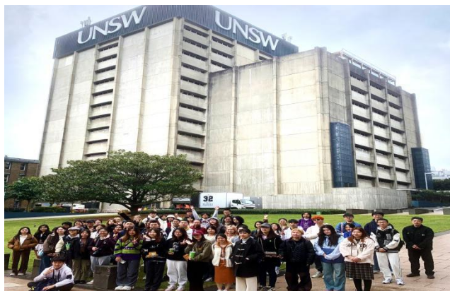
新南威尔士大学考察