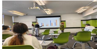
课题演讲一对一指导