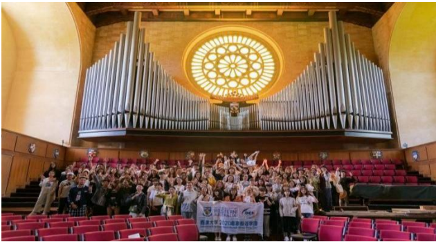
西澳大学往期访学学生合影