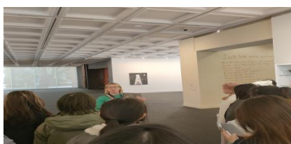
参览 UWA 文化馆