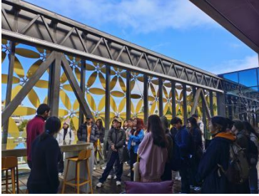
与西澳大学 PhD 交流

3. 课程以外安排相关学术交流活动，如：Workshops 和在校 PhD 一起开展交流活动、参访实验室；