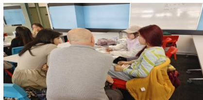
课堂一对一小组指导