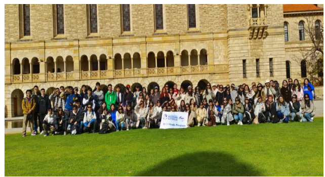
西澳大学往期访学学生合影