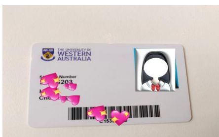
西澳大学访学学生卡

1. 注册成为西澳大学访学学生，获得学生证，使用图书馆等校内公共资源，乘坐公共交通可享受当地学生折扣待遇；