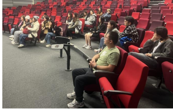
往期学生商学院交流活动

4. 视情况安排当地知名企业参访活动，认识行业发展趋势，深入了解当地企业的发展历程和现代化发展成果；