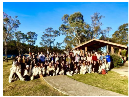
往期学生蓝山合影

6. 项目组成员完成课程后可获得悉尼大学语言中心颁发的项目结业证书，世界名校的短期课程结业证书可作为申请海外名校留学的重要背景材料；