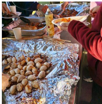
往期学生烧烤活动