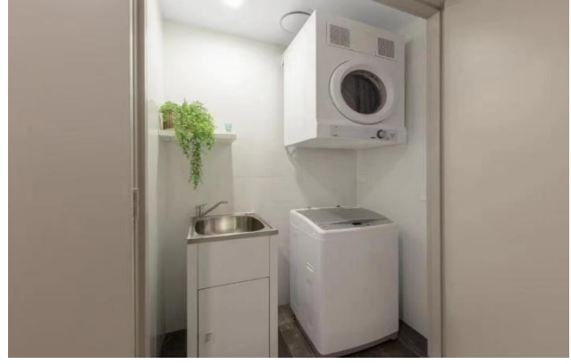
洗衣烘干设施完备