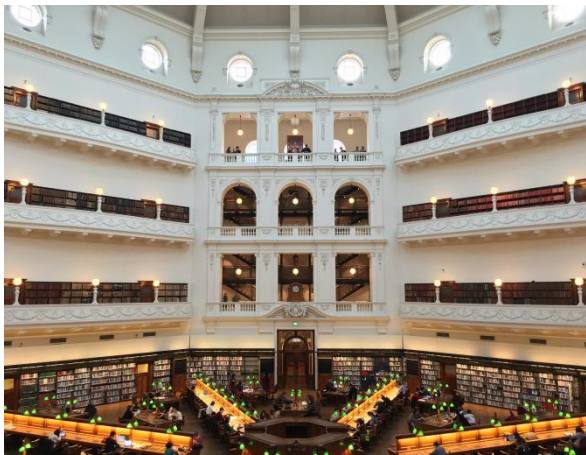
维多利亚州立图书馆