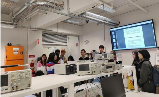
往期学生工程学院实验室参访

3. 视情况安排相关学院师生交流活动，如：可与悉尼大学工程学院教授面对面交流，参观相关工程实验室；可与悉尼大学商学院讲师面对面交流，和悉尼大学商学院往届生交流，分享海外学习和生活，为未来有志于留学的学术提供思路和帮助；