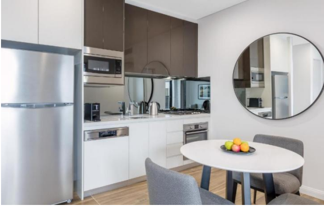
开放厨房，厨具完备，可做饭